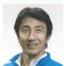
朝原 宣治 (陸上競技)